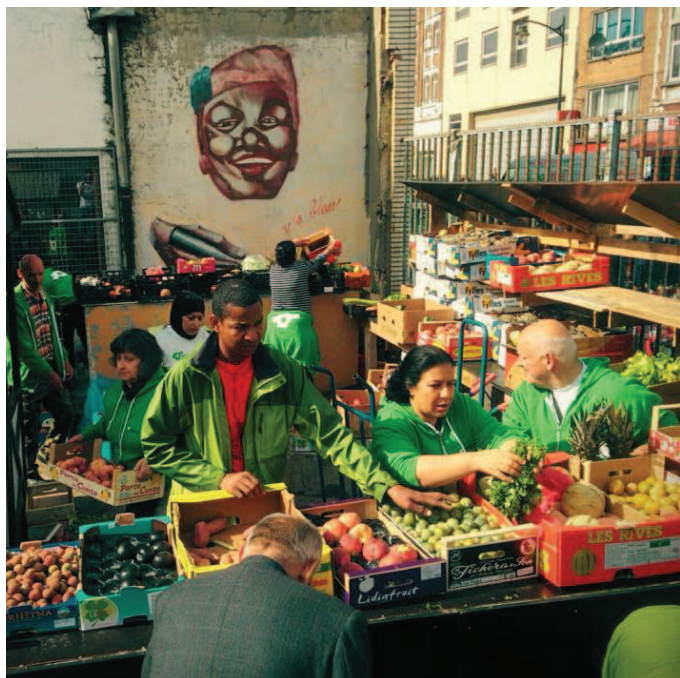
- Recycling van de onverkochte producten van Slachthuis, Cultureghem VZW'S -