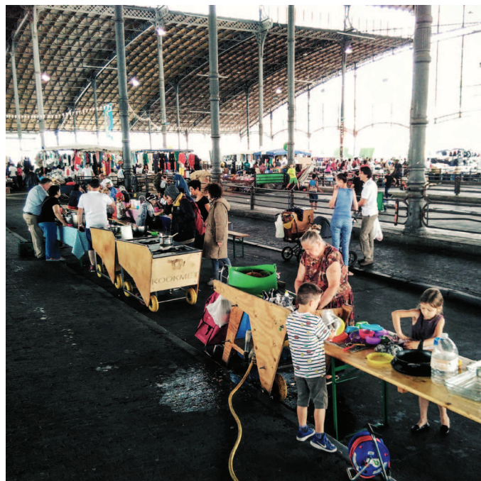
- Educatieve workshop onder de grote hal, Cultureghem VWZ'S -